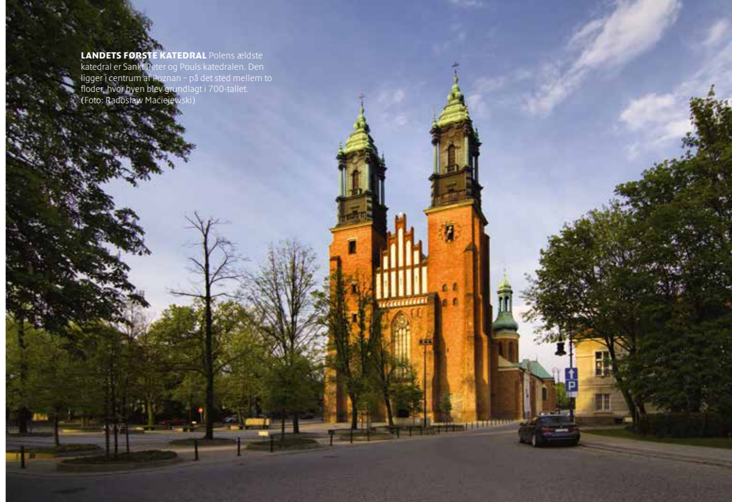
LANDETS FØRSTE KATEDRAL Polens ældste katedral er Sankt Peter og Pauls katedralen. Den ligger i centrum af Poznan – på det sted mellem to floder, hvor byen blev grundlagt i 700-tallet.