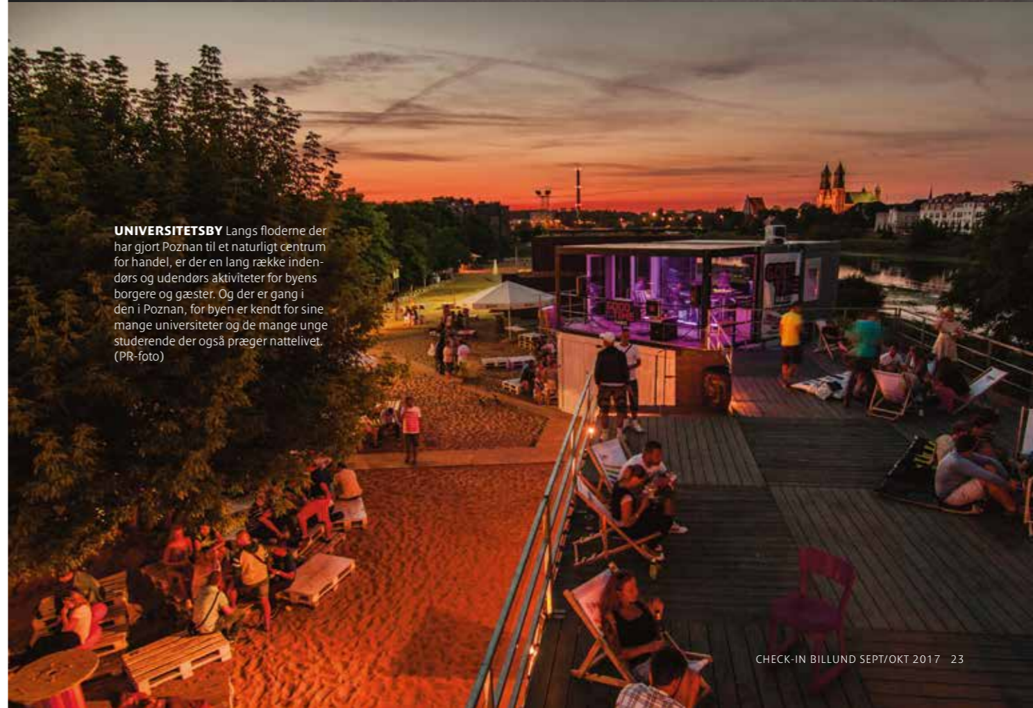
UNIVERSITETSBY Langs floderne der har gjort Poznan til et naturligt centrum for handel, er der en lang række indendørs og udendørs aktiviteter for byens borgere og gæster. Og der er gang i den i Poznan, for byen er kendt for sine mange universiteter og de mange unge studerende der også præger nattelivet.