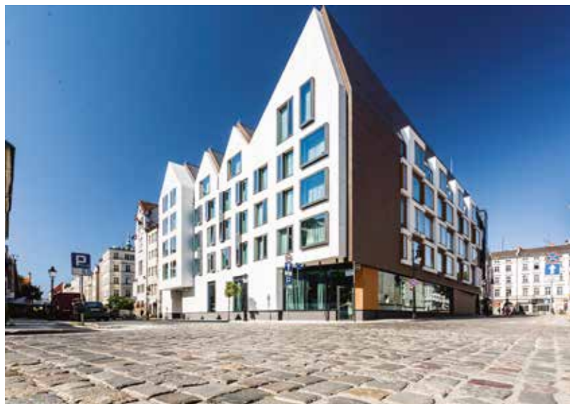
HOTELLER Poznan har talrige hoteller i flere prisklasser, og mange af dem er velegnede til fester eller andre sammenkomster som for eksempel en julefrokost. 4-stjernede Hotel Puro i centrum af byen er et af dem. Her er der også adgang til en eksklusiv lukket gårdhave som forlystelsessyge selskaber, der trækker ud, også kan have for sig selv. Puro Hotel er inspireret af skandinavisk design og livsstil.