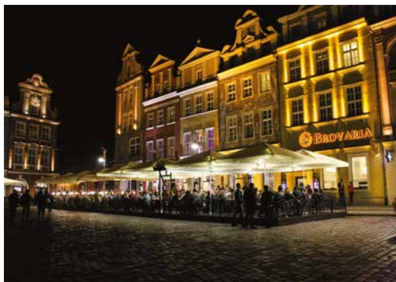
BRYGGERIER Poznan er verdensberømt for sin ølproduktion. Polens største bryggeri kommer fra byen, og mange steder findes der mikrobryggerier med deres helt egne opskrifter og metoder. Et tilløbsstykke for mange turister, der besøger byen. Det er heller ikke et tilfælde, at byens våbenskjold netop forestiller et bryggeri.